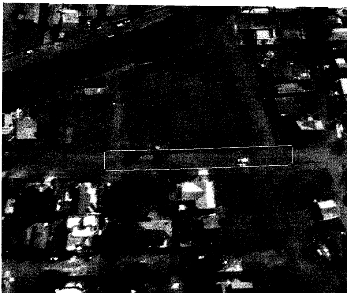
Figura 02 – Rua São José x Av. Venâncio Aires Área para asfalto