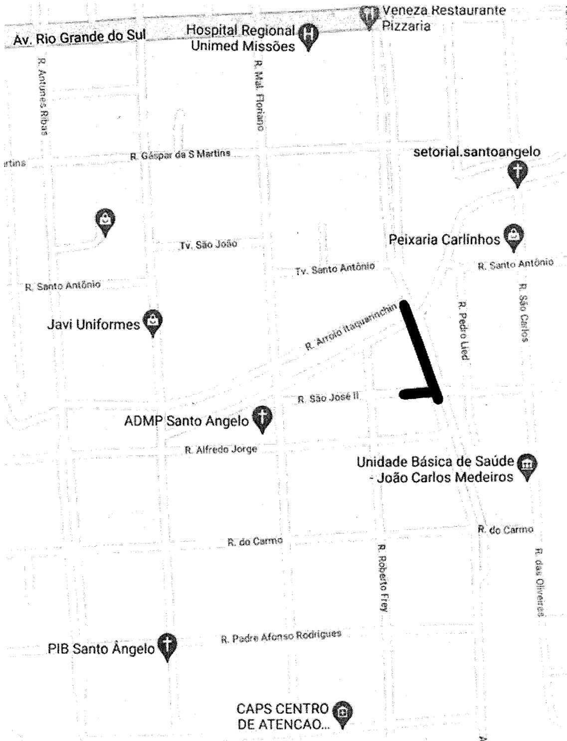
Figura 01 – Rua São José x Av. Venâncio Aires